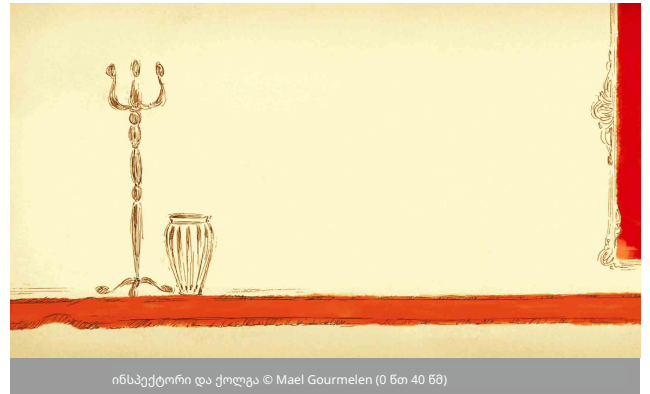
ინსპექტორი და ქოლგა © Mael Gourmelen (0 წთ 40 წმ)

ფილმში "Bunny Magic" იწყება მაცურებელი დატკბეთ ჯადოქრის შოუთ 1 წთ 20 წმ.