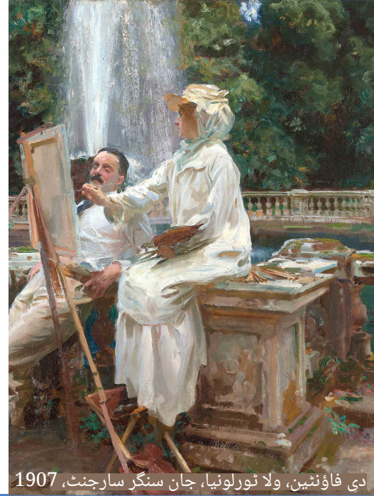
دی فاؤنٹین، ولا ٹورلونا، جان سنگر سارجنٹ، 1907

اپنے تمام تنوع میں ڈرائنگ کو اظہار کے ذریعہ کے طور پر استعمال کریں۔