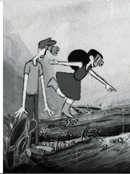
Տեսել է © Քեթի Սունգ Կի

ֆիլմ նկարահանելու նախապատրաստական աշխատանքներ.