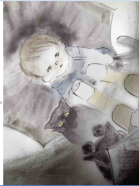
Ulan at Isda

Ang pagpapalabas ng isang animated na pelikula ay dapat magbigay-daan sa mga mag-aaral na magkita isang akda, upang tanungin ito, upang bumalangkas ng isang kritikal na paghatol, upang ipahayag ang a opinyon, isang pinagtatalunang punto ng view, upang debate, upang ihambing, upang ilagay sa pananaw, upang bumuo ng mga link sa iba pang mga gawa, iba pang sining, ibang media na nakakuha ng parehong bagay. Ito ang pagkakataon na mag-aaral upang makakuha ng kaalaman at bumuo ng mga kasanayan na maaari nilang ilagay sa pagsubok sa ibang pagkakataon.