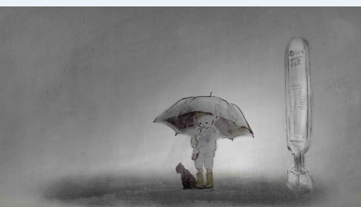
Ulan at Isda © Risa Kimpara

2.05 ay nagpapakita ng bata sa hintuan ng bus, tulad ng nakita natin dati (cf.1.19) ngunit sa ilalim ng kanyang payong, sumilong ang pusa. Hindi na nag-iisa ang bata.