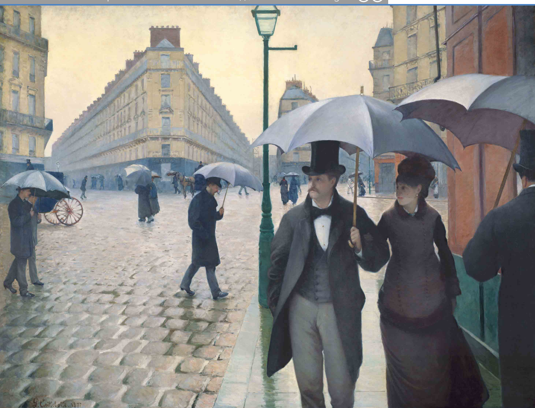
Rue de Paris, maulan na panahon, Gustave Caillebotte, 1877. Art Institute of Chicago

Hindi man namamalayan o hindi, ang mga mag-aaral ay magpapakilos din ng kanilang kaalaman at karanasan sa mismong pagtatayo ng mga kuwento, na batay sa kanilang mga inaasahan at nagbibigay-daan sa kanila na asahan ang mga pakikipagsapalaran na darating. Sa pelikula ni Risa Kimpara, ang Ang paglalahad ng kwento ay orihinal sa pagiging matino nito. Maaaring hadlangan nito ang mga mithiin ng mga batang mag-aaral, ang mga maaaring nagpakain ang mga nakaraang karanasan, na naglalagay ng mga pundasyon ng isang maagang kultura ng panitikan at sinehan. Ang pelikulang ito ay parehong salaysay, na may napakapinong narrative thread, at mapagnilay-nilay. Maaaring nakakalito.