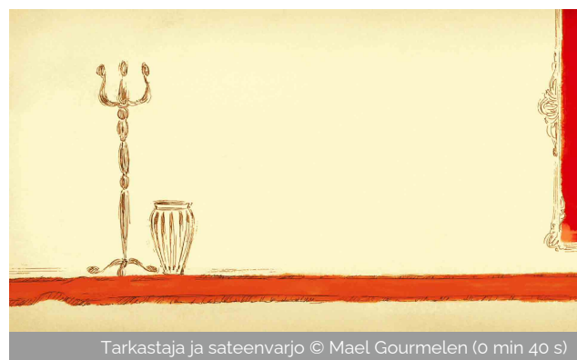
Tarkastaja ja sateenvarjo (0 min 40 s)