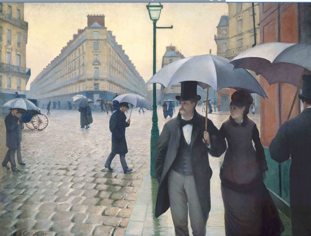
Rue de Paris, lietains laiks, Gustave Caillebotte, 1877. Čikāgas Mākslas institūts