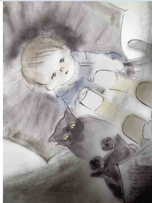
Lietus un zivis

Animācijas filmas demonstrēšanai jāļauj skolēniem satikties darbu, apšaubīt to, formulēt kritisku spriedumu, izteikt a viedoklis, argumentēts viedoklis, debatēt, salīdzināt, ievietot perspektīva, veidot saikni ar citiem darbiem, citām mākslām, citi plašsaziņas līdzekļi, kas konfiscējuši to pašu objektu. Šī ir iespēja skolēniem apgūt zināšanas un veidot prasmes ko viņi var pārbaudīt citreiz.