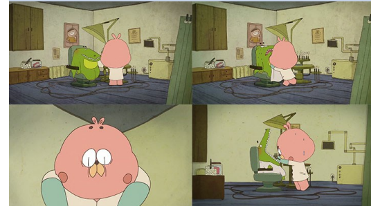
Planche d'expression 02