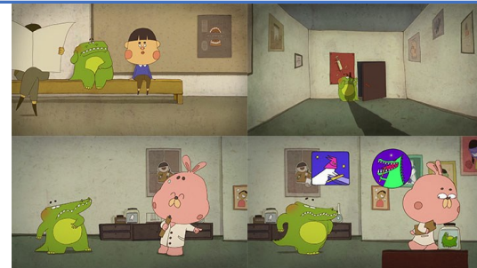
Planche d'expression 01

Les dessins peuvent être présentés à l'ensemble de la classe en fin de séance.