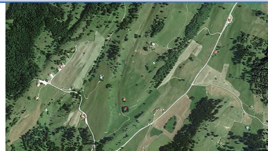
montagne dans le Jura, France