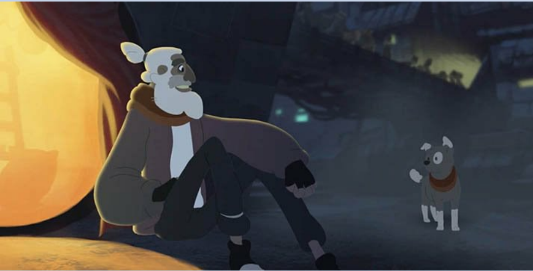
Vagabond © The Animation Workshop

Réaliser individuellement ou collectivement une production plastique.