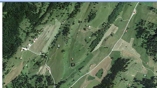
montagne dans le Jura, France