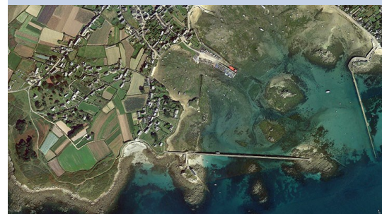
Ile de batz, Finistère, France