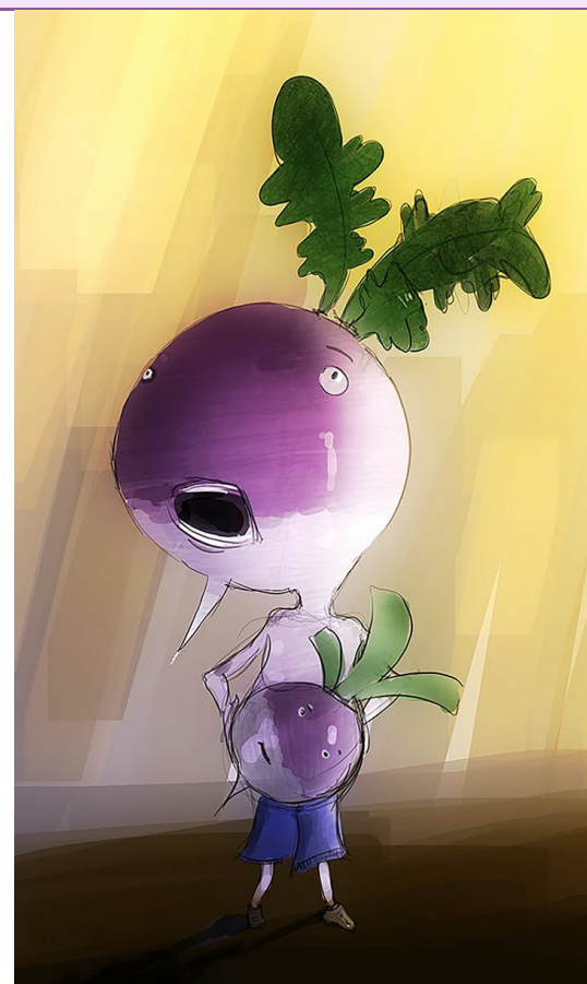
Personnage mutant.

- On peut s'inspirer (en plus du film) des albums Mister O et Mister I , de Lewis Trondheim (éd. Delcourt) qui utilisent exactement le principe de début et fin contraints.