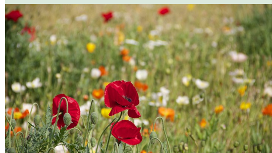
Un carré pour la Biodiversité