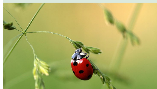
Un carré pour la Biodiversité