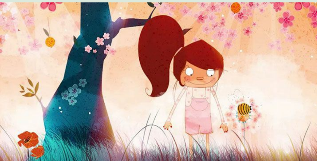
Un carré pour la Biodiversité

Connaître des caractéristiques du monde vivant, ses interactions, sa diversité