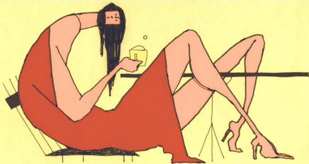
Two tea two

Identifier les caractéristiques propres à différents genres de textes : le dialogue.