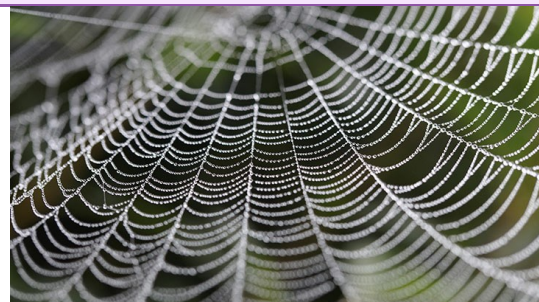
Toile d'araignée. CCO

Le principe de transcription qui sous-tend l'activité réside dans l'enchaînement des trois composantes, le résultat de l'une étant pris comme point de départ pour une autre. Elles peuvent donc être pratiquées dans n'importe quel ordre. On peut prendre cette structure comme technique de créativité. Pour des