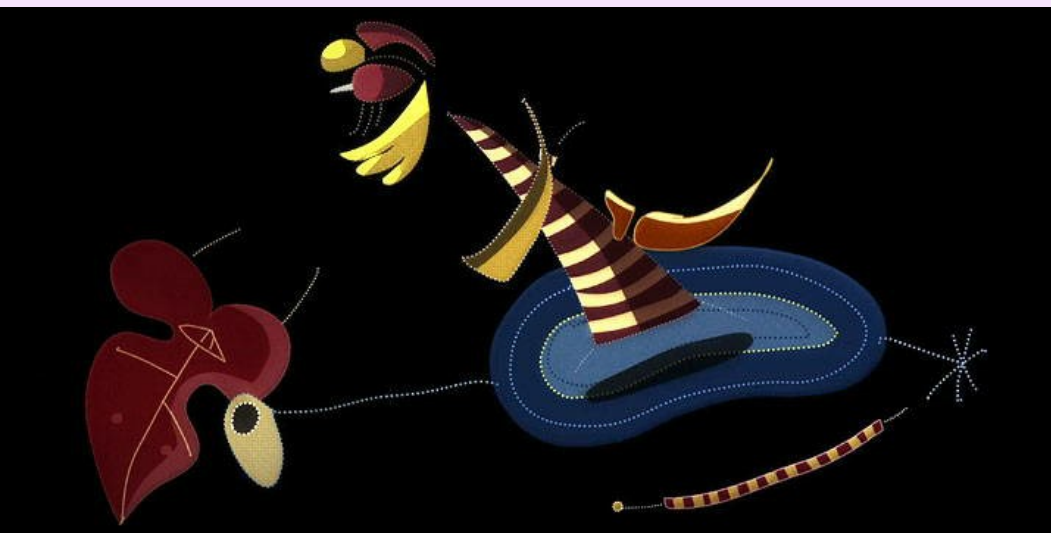
The Sleepwalker

Représenter le monde environnant ou donner forme à son imaginaire en explorant la diversité des domaines (dessin, peinture, collage...)