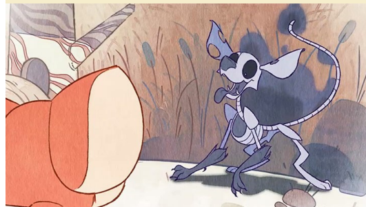
The Shadow Folk © Sabrina Cotugno