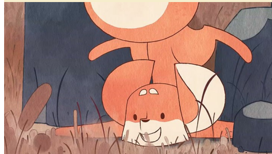
The Shadow Folk © Sabrina Cotugno