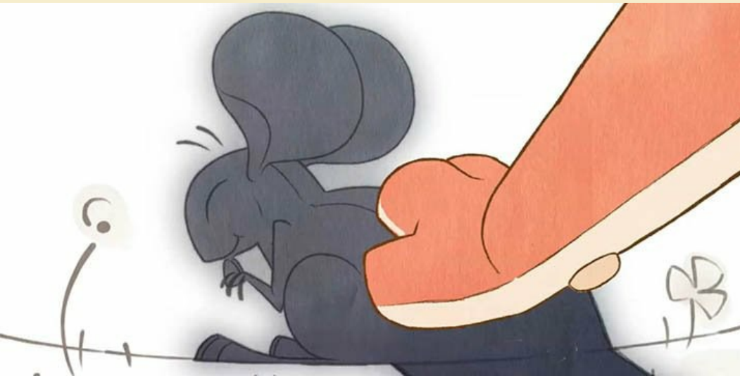
The Shadow Folk © Sabrina Cotugno

Comprendre des documents et des images et les interpréter. Produire des écrits variés.