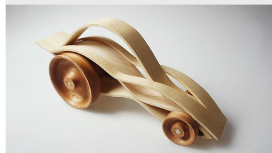
Voiture miniature, Julie Liang, 2015. CC BY-NC 4.0