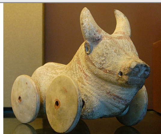
Buffle sur roulettes, Grèce Antique. CCO