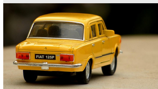
Voiture miniature Fiat 125P. CCO