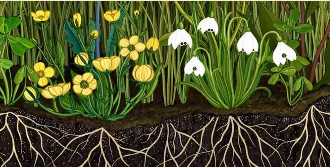
Story of Flowers © Tounoki

Pratiquer divers usages du langage oral : raconter, décrire, évoquer, expliquer, questionner, proposer des solutions, discuter un point de vue.