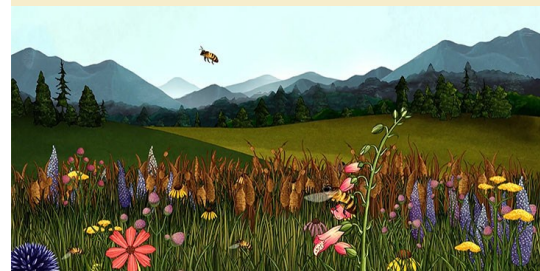
Story of Flowers