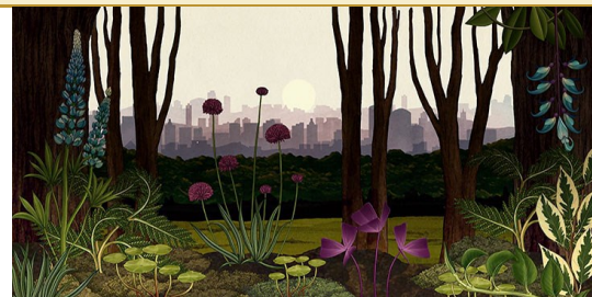
Story of Flowers © Tounoki

- Travail autour de l'album « Trognon et Pépin » de Bénédicte Guettier. L'histoire relate la vie de deux pommes qui traversent les saisons. Après le danger des oiseaux, du soleil, des passants et des vers, c'est le vent d'automne qui les fait tomber, mais leurs pépins germeront et donneront naissance à deux pommiers.