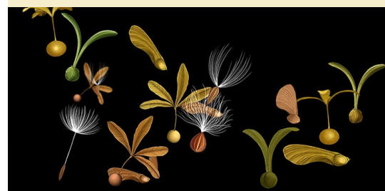
Story of Flowers © Tounoki