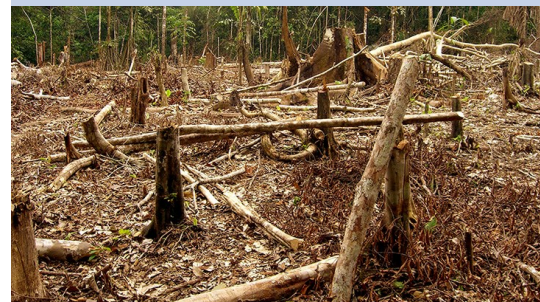
Déforestation, Matt Zimmerman. CC0