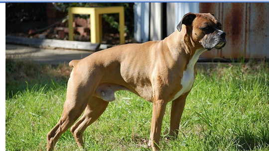
Chien, Brandon. CCO

Peut-on domestiquer tous les animaux ? (cas du renard par exemple que l'homme n'a pu domestiquer ou bien des félinés sauvages, des hyènes...)