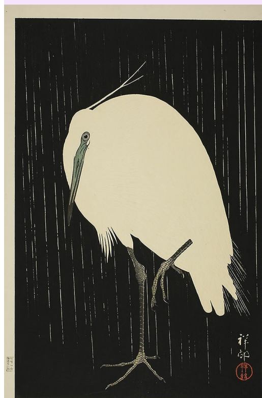
Aigrette debout sous la pluie, Ohara Koson, 1928. The Art Institute of Chicago. CCO