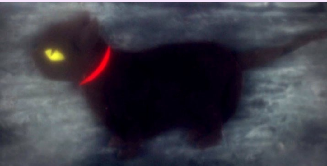
Rain shower

Utiliser le dessin dans toute sa diversité comme moyen d'expression.