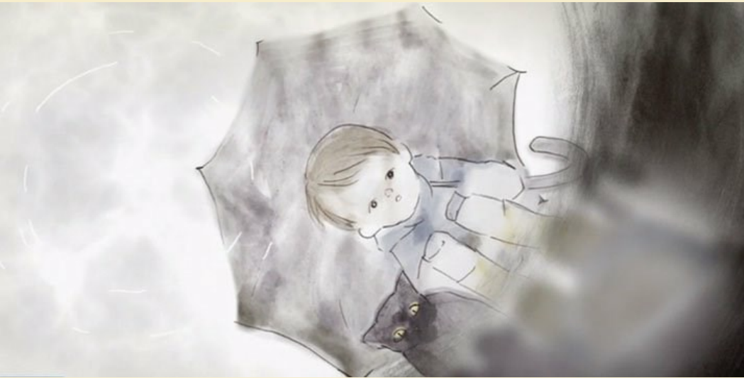
Rain and Fish © Risa Kimpara / Tokyo University of the Arts

Identifier et exprimer en les régulant ses émotions et ses sentiments. Être capable d'écoute et d'empathie.