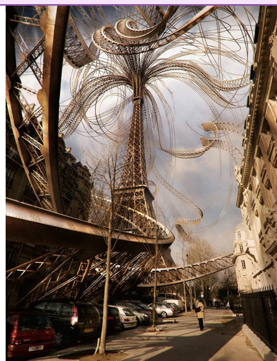
Tour Eiffel, photo + dessin 3D, © Olivier Defaye