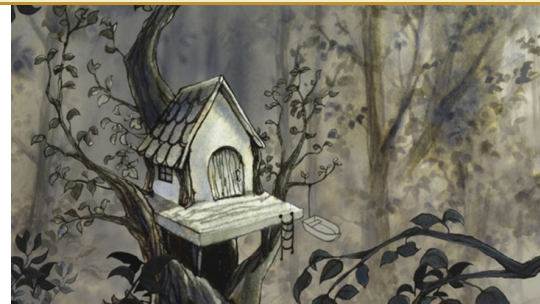
Ollie's Forest © Reina Kanemitsu