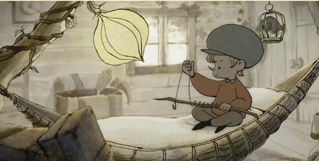
Ollie's Forest © Reina Kanemitsu

Après révision, obtenir un texte organisé et cohérent, à la graphie lisible et respectant les régularités orthographiques étudiées au cours du cycle.