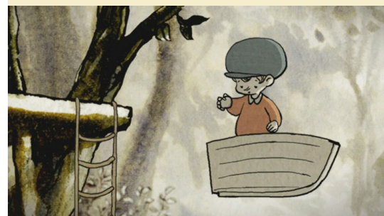
Ollie's Forest © Reina Kanemitsu