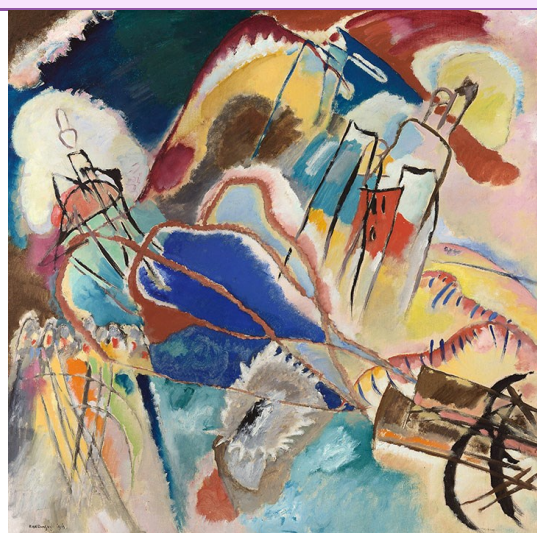
Untitled, Vasily Kandinsky, 1922

Plus d'informations sur Vassily Kandinsky et Joan Miró .