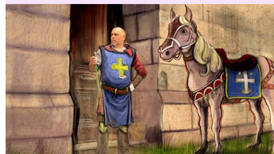
5 min 37 s : changement d'époque