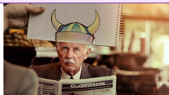
4 min 11 s : le chien dragon

- En arts plastiques : se transporter à une autre époque. Prendre une photo de la façade de l'école ou du patrimoine local. Imprimer en noir et blanc et le modifier à la craie grasse pour le transporter à une autre époque.