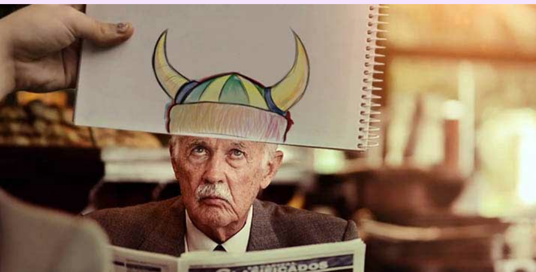
Lila © Carlos Lascano

Cycle 3 : L'invention, la fabrication, les détournements, les mises en scène des objets : création d'objets, intervention sur des objets, leur transformation ou manipulation à des fins narratives, symboliques ou poétiques.