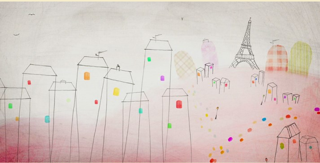
Les petites choses de la vie © Benjamin Gibeaux

Produire des écrits : trouver et organiser des idées, élaborer des phrases et les écrire. Se construire une posture d'auteur.