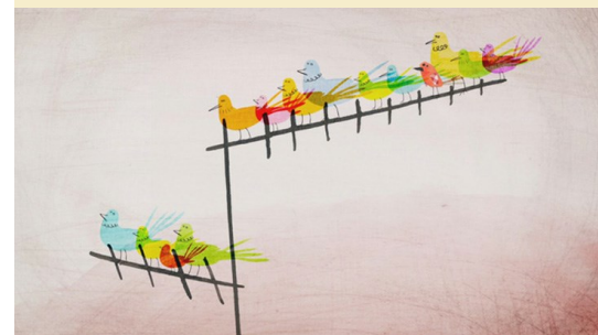
Les petites choses de la vie