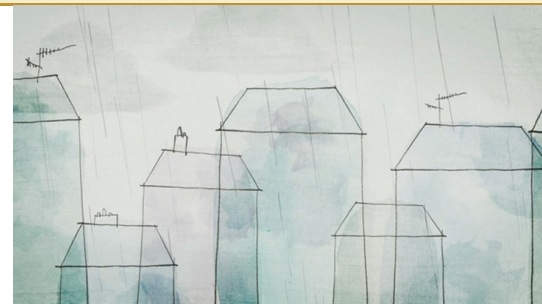
Les petites choses de la vie © Benjamin Gibeaux

Dessiner les illustrations de cette suite.