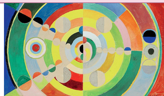
Rythme, Robert Delaunay, 1932. Collection particulière.