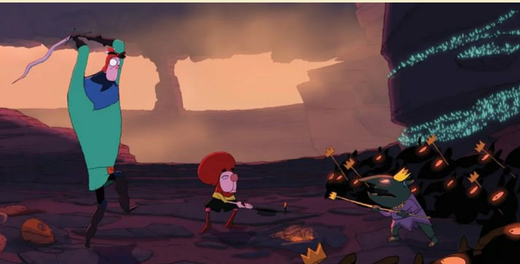
Grandma's Hero

Mettre en œuvre une démarche de production de texte. Utiliser les outils informatiques.