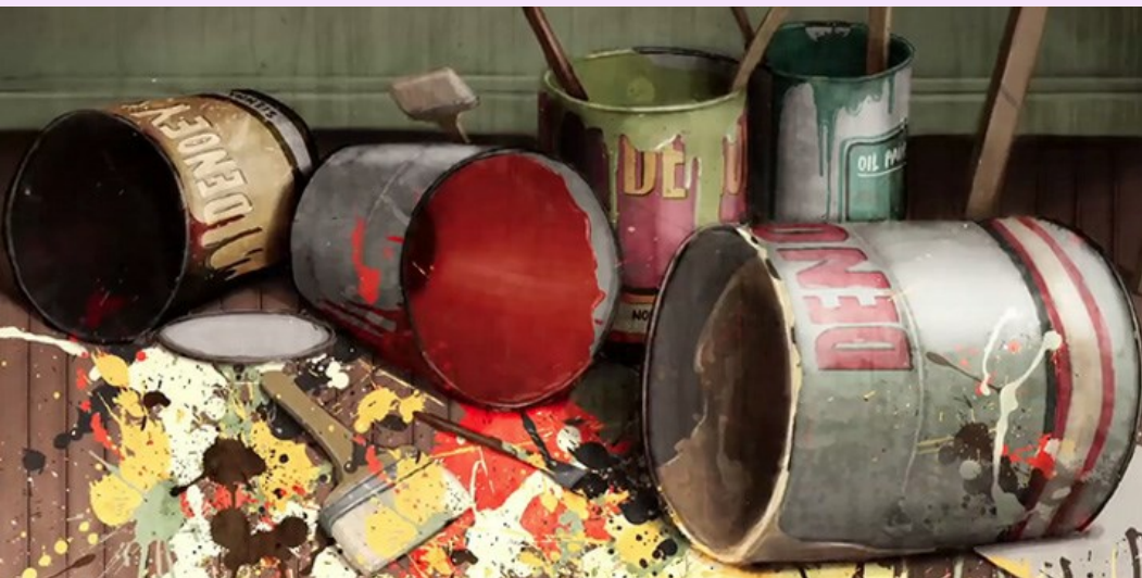
Dripped © Eddy

Réaliser individuellement ou collectivement une production plastique