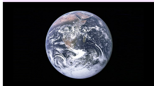
La Bille bleue, NASA. CC0