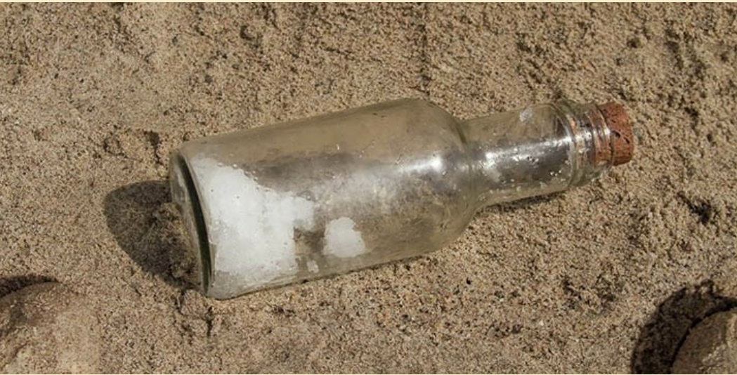
Bottle © Kirsten Lepore

Conserver une attention soutenue lors de situations d'écoute Produire des énoncés clairs