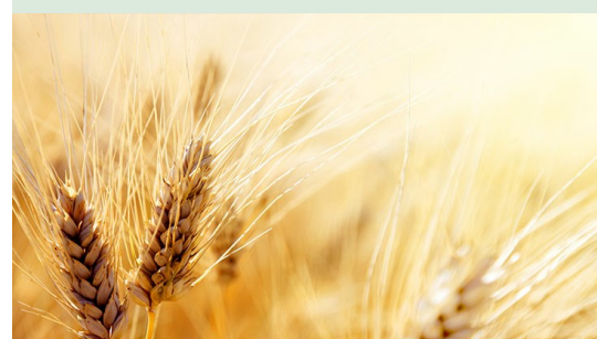
Découverte de l'été.