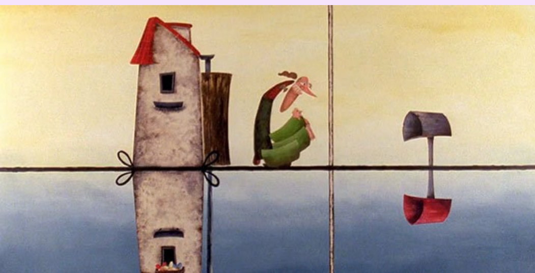
Antipoden © Frodo Kuipers

Donner forme à son imaginaire en explorant divers domaines (dessin, collage...). Rechercher une expression personnelle en s'éloignant des stéréotypes.