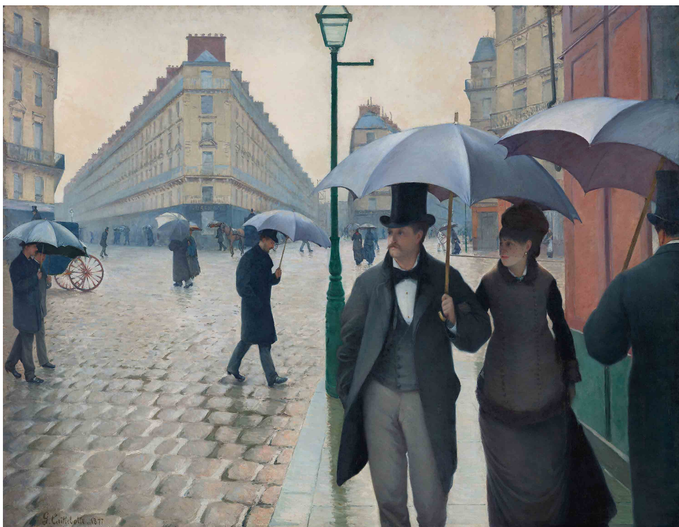
Rue de Paris ; temps de pluie, Gustave Caillebotte, 1877, Institut d'art de Chicago, CC0.

Activité proposée par Christophe Defaye.