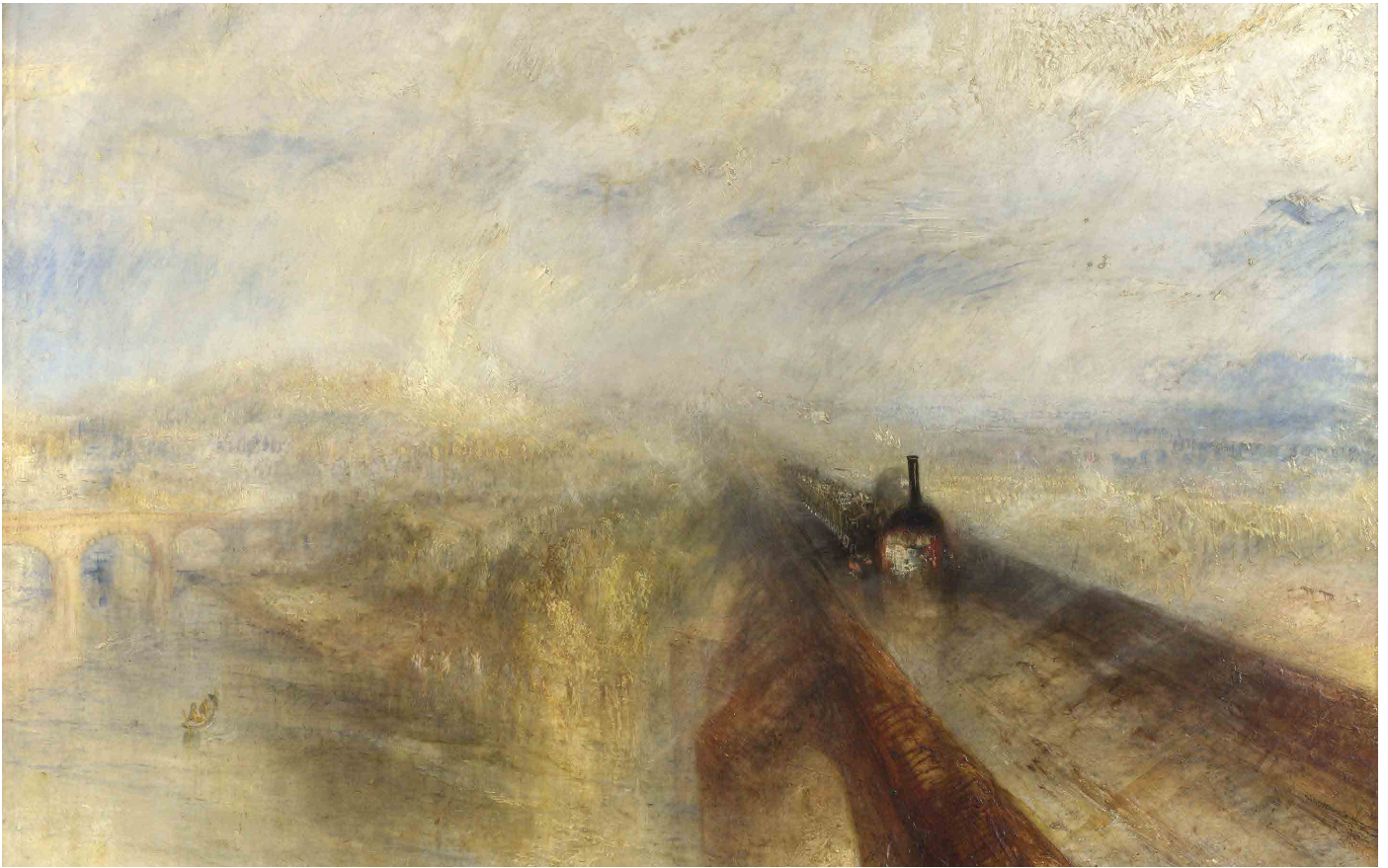
Pluie, Vapeur et Vitesse, William Turner, 1844, The National Gallery. CC BY NC ND 4.0.