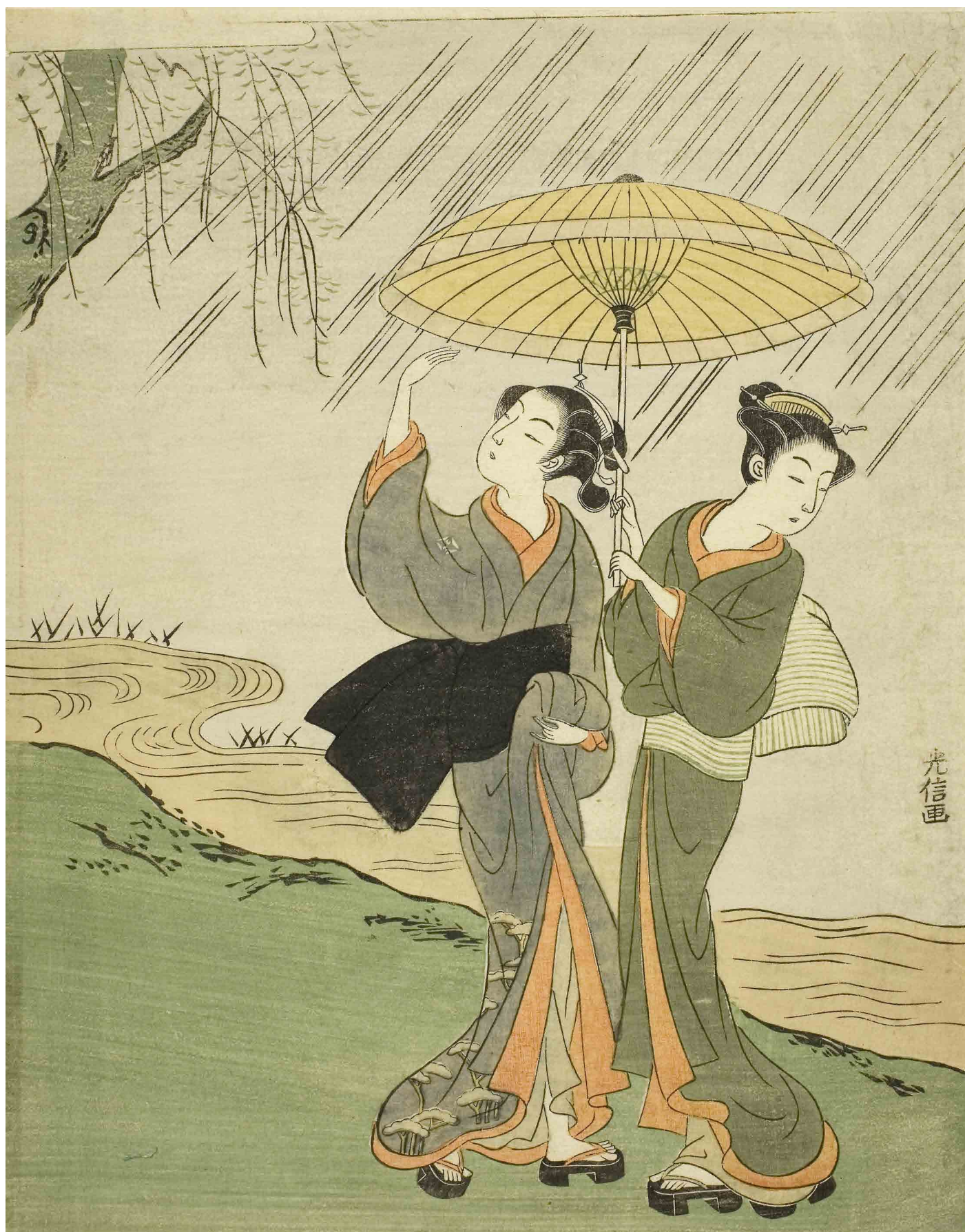
Two Young Girls in a Rain Shower, Mitsunobu, 1764, Institut d'art de Chicago, CC0.

Décrire les peintures représentant la pluie puis imaginer une manière de représenter la pluie.