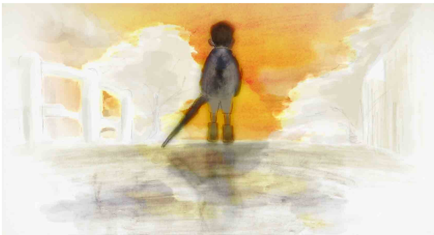
Rain and Fish, court-métrage de la plateforme, 2015. Rain and Fish © Risa Kimpara / Tokyo University of the Arts