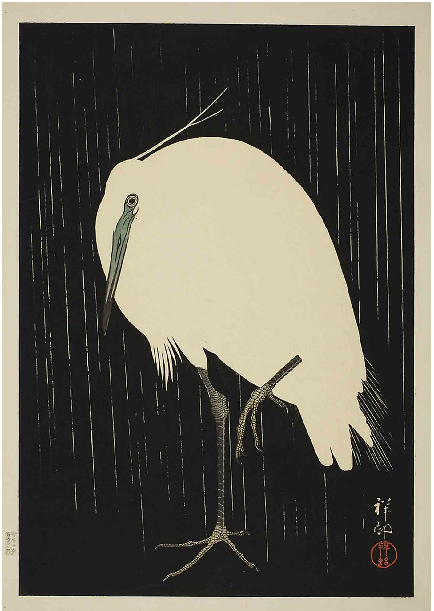
Aigrette debout sous la pluie, Ohara, Koson, 1928, Institut d'art de Chicago, CC0.

Activité proposée par Christophe Defaye.