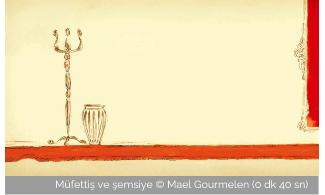
Müfettiş ve şemsiye © Mael Gourmelen (0 dk 40 sn)

"Bunny Magic" filminde seyirciler başlıyor 1 dakika 20 saniyeden itibaren sihirbaz gösterisinin keyfini çıkarın. Ne için ?