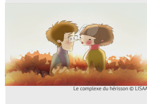
Le complexe du hérisson