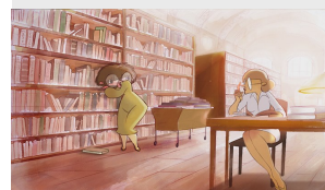
Le complexe du hérisson