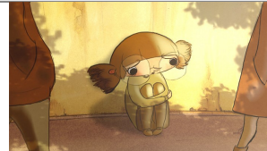
Le complexe du hérisson