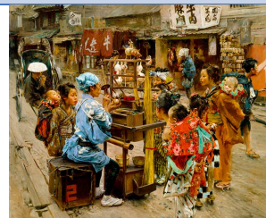
The Ameya (marché des confiseries), Robert Frederick Blum (1893) MET. CCO

On pourra alors leur proposer de mettre en place un marché des connaissances. Ce marché est une sorte de kermesse dans laquelle les élèves proposent une activité que les autres élèves vont pouvoir découvrir et apprendre. Ils sont 100% acteurs et doivent tout préparer. Il va falloir choisir ses partenaires, l'activité, lister le matériel nécessaire. Les élèves vont devoir s'organiser et coopérer afin de mettre en place leur stand. Définir précisément ce qui sera présenté, proposé, le temps que cela prendra. De quel matériel ils auront besoin. Leur demander de faire une affiche à destination des visiteurs. Durant toutes ces étapes, l'enseignant va aider, corriger, s'assurer que l'activité est réalisable. Toute cette préparation sera l'occasion de travailler dans différentes disciplines. Le jour du marché, les élèves