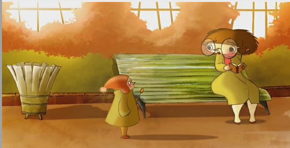
Le complexe du hérisson

Titre Le complexe du hérisson Thème Genre et mots-clés manque de confiance Cycle 2, 3 Durée 02 min 36 s Réalisation J.Robin & P.Chuop & Chloé Goussé & A.Monge & P.Brunner Musique Jimmy Mendes Production LISAA (France, 2013)